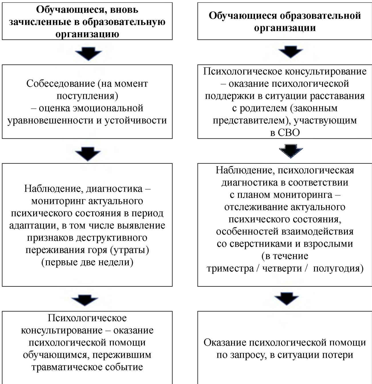
Схема выстраивания работы педагогов-психологов / психологов по психологическому сопровождению детей ветеранов (участников) СВО в зависимости от статуса пребывания обучающегося в образовательной организации

Каждое направление деятельности педагога-психолога / психолога включается в единый процесс сопровождения, обретая свою специфику, конкретное содержательное наполнение в форме программ адресной помощи (далее – психолого-педагогические программы) с учетом выявленных психолого-педагогических проблем, рисков и трудностей обучающихся целевой группы.